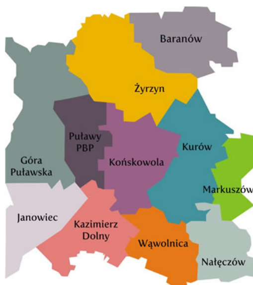
II. 1. Sieć bibliotek powiatu puławskiego

Trudności lokalowe (biblioteka pięciokrotnie zmieniała swoją siedzibę) i kadrowe nie przeszkodziły, żeby PBP w Puławach zaistniała w świadomości społeczności lokalnej jako ważna placówka kulturalna, której działania znacznie wykraczają poza obręb zadań statutowych. Priorytetowym zadaniem naszej biblioteki jest pomoc instrukcyjno-metodyczna i szkoleniowa dla sieci bibliotek: 1 biblioteki miejskiej, 2 bibliotek miejsko-gminnych, 8 bibliotek gminnych i ich 17 filii oraz 23 punktów bibliotecznych (II. 1).