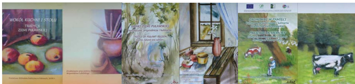
Fot. 1. Okładki publikacji wydanych przez Powiatową Bibliotekę Publiczną w Puławach.

PBP od roku 2009 jest także wydawcą kwartalnika powiatowego „Tu Jest Moje Miejsce” (Fot. 2). Wchodzi w skład Komitetu Redakcyjnego i jest odpowiedzialna za dział Kultura, Tradycja i Historia Regionu. Wydawany kwartalnik to czasopismo o charakterze społeczno-kulturalno-turystycznym, stworzone po to, aby mieszkańcy mieli okazję do lepszego poznania historii powiatu, jego zasobów kulturalnych, społecznych, przyrodniczych i turystycznych. Wydawnictwo zawiera zbiór bieżących informacji, prezentuje najważniejsze wydarzenia, spotkania, programy, instytucje oraz przedstawia sylwetki ludzi, którzy swoją pracą i zaangażowaniem każdego dnia przyczyniają się do rozwoju lokalnej społeczności.