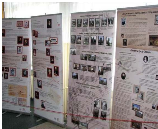
Fot. 4. Wystawa o Fryderyku Chopinie