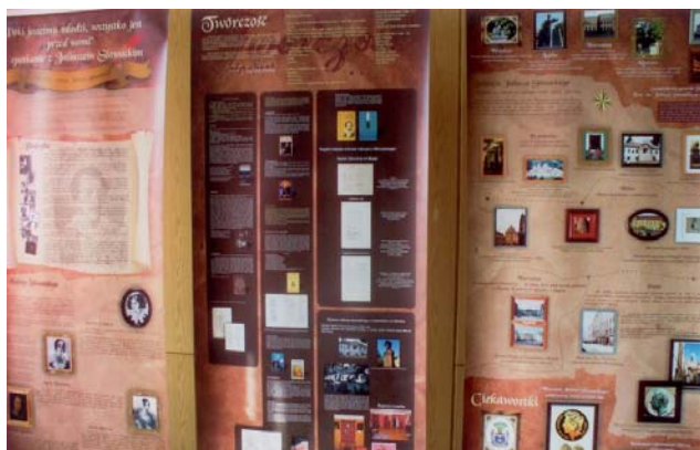
Fot. 3. Wystawa o Juliuszu Słowackim

ciekawostki, takie jak pomniki wieszczą w Polsce oraz trasa wycieczki turystycznej śladami Słowackiego. W 2010 r. wystawa dotyczyła Chopina: „Fryderyk Chopin — Polak, a talentem świata obywatel”. Wystawa rozpisana została na pięć tablic. Pierwsza stanowiła część tytułową, druga i trzecia pokazywała przełomowe momenty z życia kompozytora. Trzecia tablica opisywała muzyczną i nauczycielską karierę Chopina. Związki Chopina z Lubelszczyzną i jego ciekawe życie towarzyskie stanowiły temat tablicy czwartej. Na ostatniej tablicy umieszczone zostały pomniki Chopina postawione w Polsce i na całym świecie. Nie mogło także zabraknąć informacji o Muzeum w Żelazowej Woli i o Międzynarodowym Konkursie Pianistycznym im. Fryderyka Chopina w Warszawie. Wszystkie wystawy są wydrukowane na banerach wystawienniczych, co znacznie ułatwia sposób transportu i prezentowanie ekspozycji niekiedy w bardzo małych pomieszczeniach bibliotecznych. W tym roku z okazji rocznicy Czesława Miłosza biblioteka ogłosiła konkurs: „Zareklamuj twórczość Czesława Miłosza”. Forma reklamy zależy tylko i wyłącznie od kreatywności uczestników. Począwszy od formy papierowej, a skończywszy na prezentacji multimedialnej. Liczy się pomysł i oryginalność wykonania.