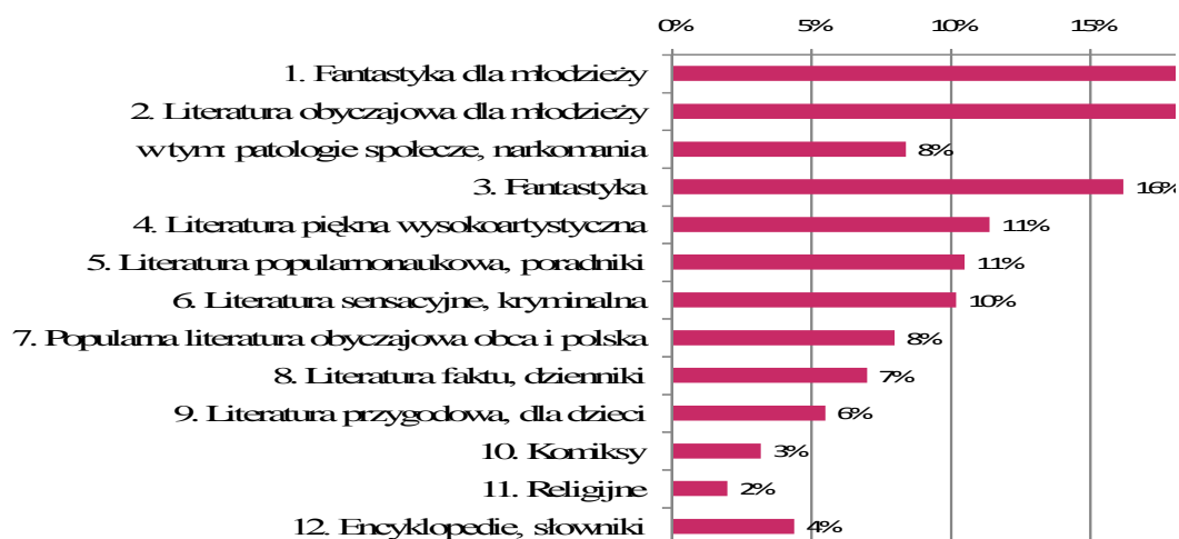
: Wykres 1: Typy książek najpoczytniejszych wśród polskich gimnazjalistów N=100% 1 =1472